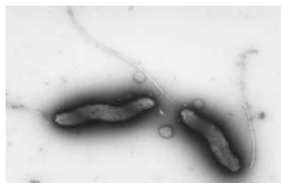
カンピロバクターの電子顕微鏡写真